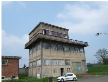
Les bureaux et atelier du théâtre de chambre à Aulnoye-Aymeries, ancienne tour d'aiguillage de la SNCF

Une cinquantaine de bénévoles, membres de l'association, participent activement à l'élaboration et à la mise en place des projets.