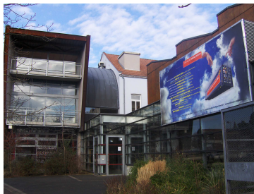
Le Théâtre de l'Oiseau-Mouche/Le Garage.

Avant tout lieu de création et de recherche théâtrale, le Théâtre de l'Oiseau-Mouche s'ouvre chaque saison à d'autres équipes artistiques disposées à s'engager dans un partenariat actif avec la compagnie. Ces périodes de résidence sont pensées en trois volets : temps de travail partagé entre nos compagnies, mise à disposition d'un espace de répétition pour trois semaines minimum et rapport au public à travers des actions de sensibilisation et des ateliers menés de concert avec les comédiens de l'Oiseau-Mouche, en accompagnement du spectacle accueilli.